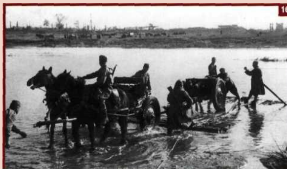
16. Переправа войск через Десну. 1943 г.