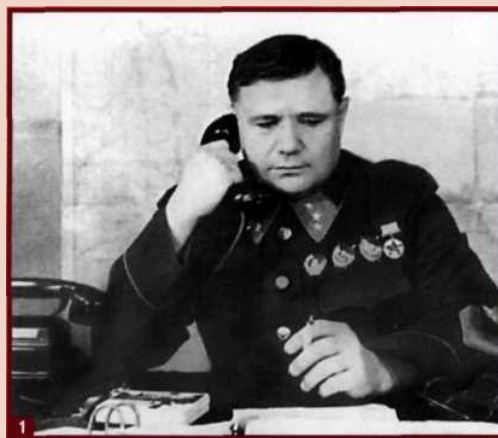
А. И. Еременко — командующий Брянским фронтом в 1941 г.

По решению Ставки Верховного Главнокомандования 16 августа был образован Брянский фронт в составе 50-й и 13-й армий, который возглавил генерал-лейтенант Андрей Иванович Еременко. Причем 50-я армия была создана в Брянске в те же августовские дни. В задачу Брянского фронта входило прикрытие Московского стратегического района и максимальное ослабление противника. Для гитлеровцев Брянщина была плацдармом для наступления и овладения Москвой, в силу этих обстоятельств роль Брянского фронта была особенно важна. Войскам Брянского фронта на 59 дней удалось задержать продвижение противника к столице.