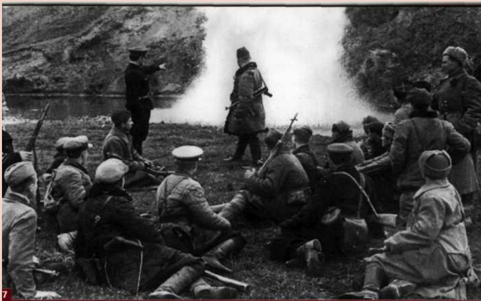
7. Занятия партизан-подрывников.