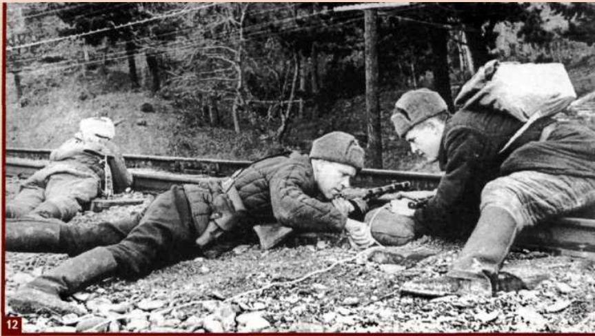
12. Минирование железной дороги.