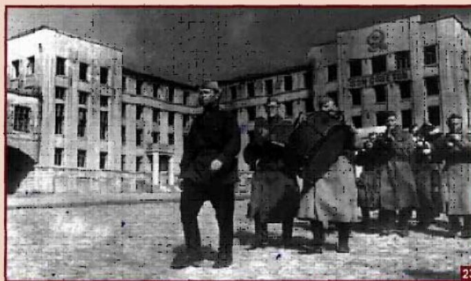
20. Командующий 11-й гвардейской армией Брянского фронта И.Х.Баг-рамян.